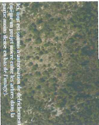
Ici, tout est soumis à autorisation de défrichement (même un projet misère entre les arbres dans la partie moins dense en bas de l'image).