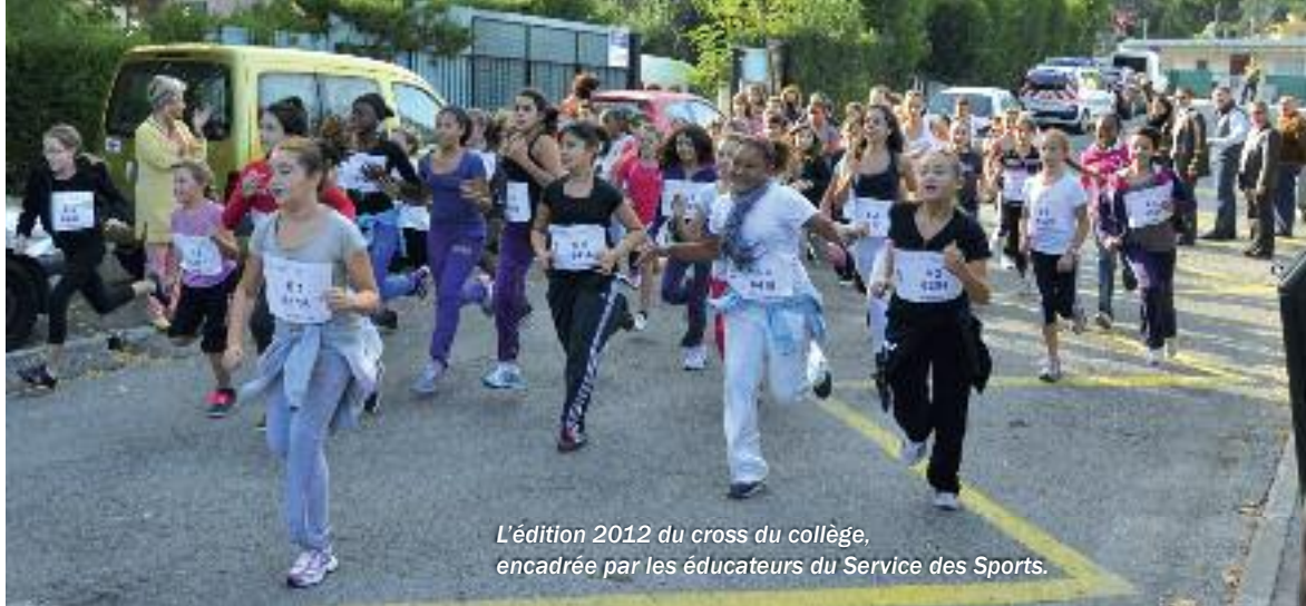
L'édition 2012 du cross du collège, encadrée par les éducateurs du Service des Sports.